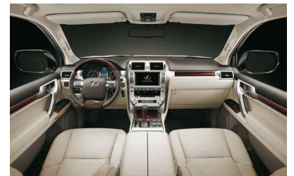
Цвета салона: Бежевая кожа, Черная кожа, Серо-коричневая кожа, Коричневая кожа Вставки: дерево Махагони